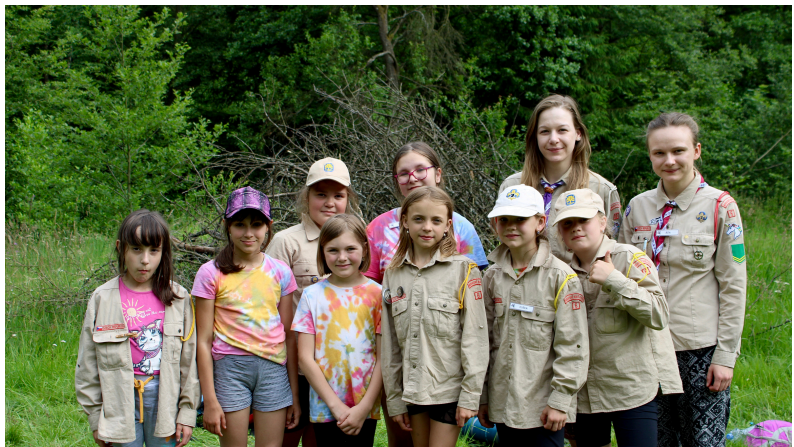
Krajské kolo ZVaSu