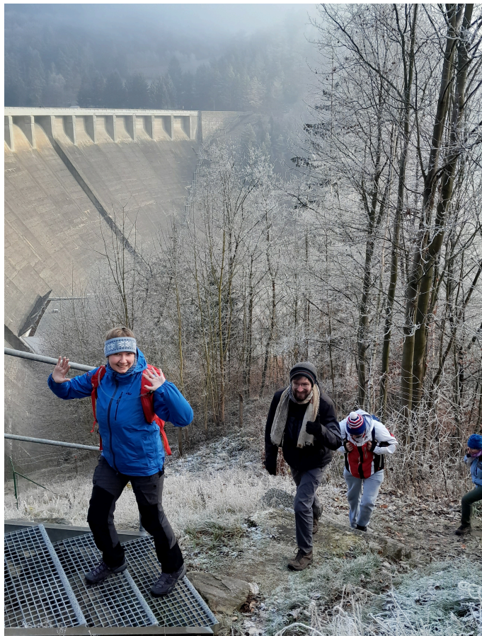
Silvestr u Nového Města na Moravě