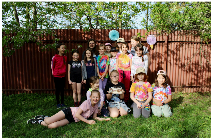
Oslava postupu do krajského kola