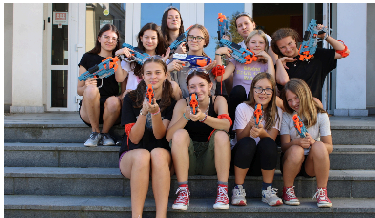
První letošní výprava