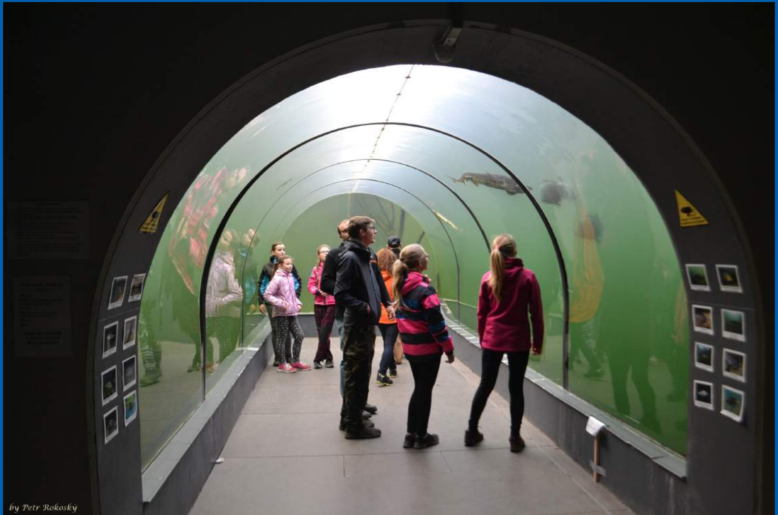
by Petr Rokosky